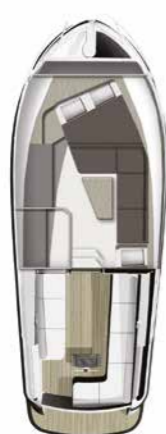
Lounge met Dubbel bed