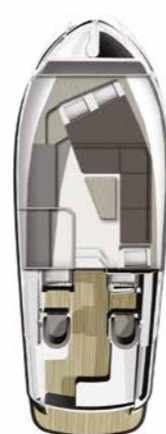
Comfort met Dubbel bed