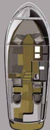
Comfort met V bed